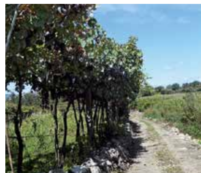
Pilgrimsvandring fra Portugal til Santiago de Compostela. www.elisabethlidell.dk