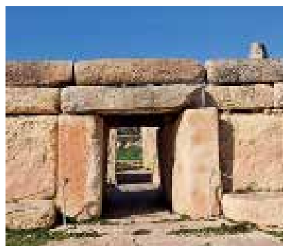
Billeder fra øen Gonzo tæt på Malta