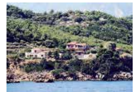
Billeder fra Samos, meditationscen-tret Villa Eva, www.spirituellejser.dk