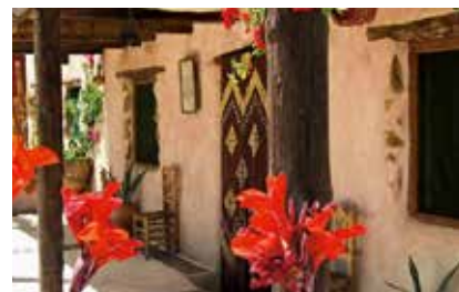
The Hacienda er beliggende ca. 1½ times kørsel nordøst for Malaga, nær en lille by med navnet Montefrio. www.mindfultravel.dk